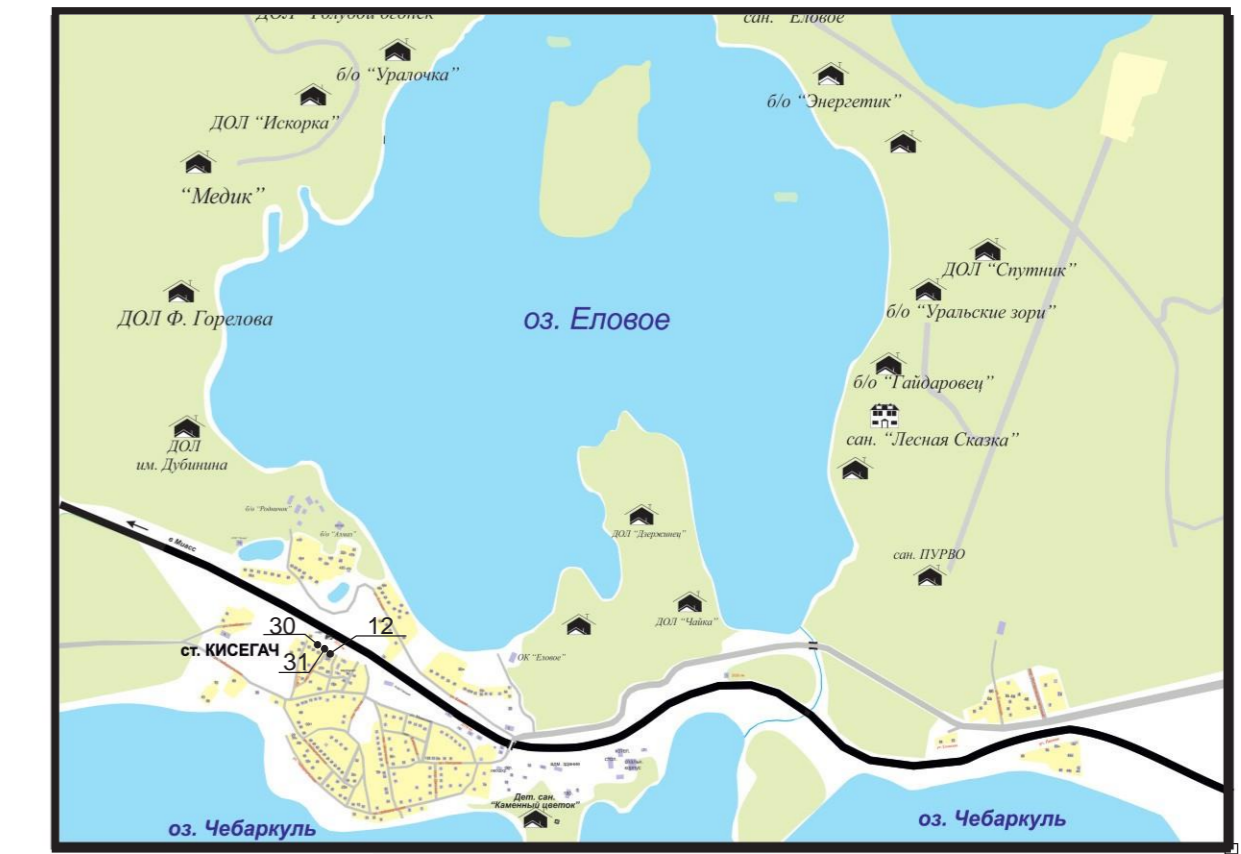
Местоположение нестационарного торгового объекта (адрес нестационарного торгового объекта или адресный ориентир, позволяющий определить фактическое местоположение нестационарного торгового объекта)