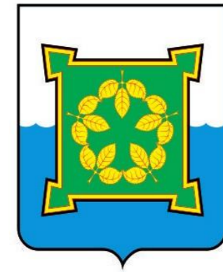
СХЕМА РАЗМЕЩЕНИЯ НЕСТАНЦИОНАРНЫХ ТОРГОВЫХ ОБЪЕКТОВ НА ТЕРРИТОРИИ ЧЕБАРКУЛЬСКОГО ГОРОДСКОГО ОКРУГА